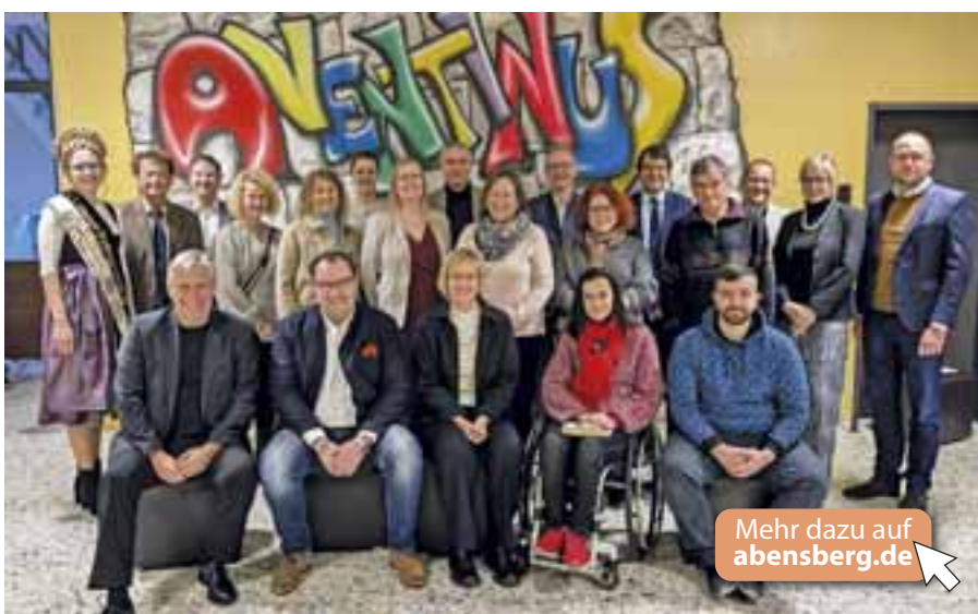
Wer vorgelesen hat, steht auf der Homepage der Stadt.