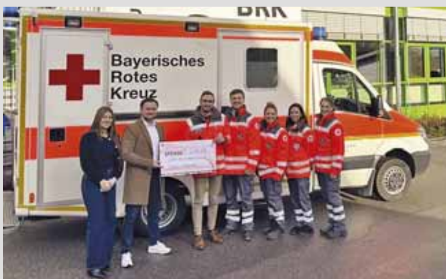
Hofmann Automobile setzte eine Tradition fort, die bereits im letzten Jahr begonnen wurde und auf großen Zuspruch stieß.