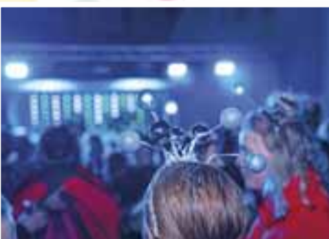
Bilder: Holzhäuser