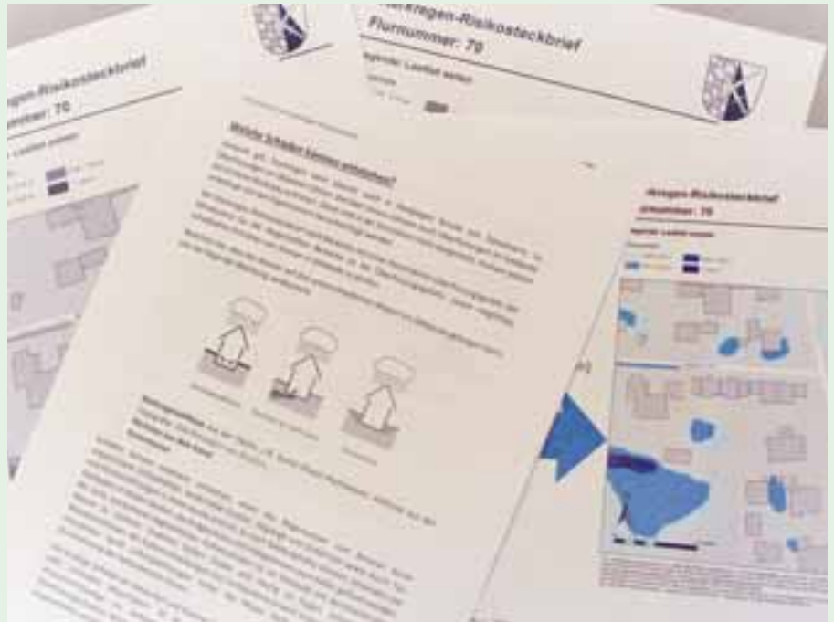
Der Starkregen-Risikosteckbrief ist auf der Homepage umgezogen – man findet ihn jetzt hier: www.abensberg.de/starkregen-formular

Künftig gilt: Bürger aus den Ortsteilen rufen die Startseite www.abensberg.de/starkregen-formular auf, klicken auf den blauen Button „Starkregen Auskunft System“ und tragen in der Zeile „Kom-mune suchen“ dann Abensberg ein. Hier kann man allgemeine Informationen zum Schutz vor Starkregen aufrufen oder den Risikosteckbrief für das eigene Grundstück anfordern. Der Starkregen-Risikosteckbrief enthält einen allgemeinen und einen flurstücksspezifischen Teil. Im allgemeinen Teil werden praktische und rechtliche Informationen zu Starkregenereignissen, zum Wasserhaushaltsgesetz, zur Schadensvorsorge und vieles mehr gegeben. Die Tipps sind anschaulich und reichen bis zu einer Übersicht über mögliche Wasserzutrittswege und Schutzmaßnahmen.