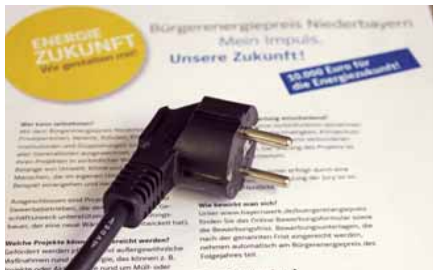
Teilnahmebedingungen, Online-Bewerbung und mehr sind im Internet unter www.bayernwerk.de/buergerenergiepreis zu finden.

Seit 13 Jahren rufen die Bayernwerk Netz GmbH und die Regierung von Niederbayern zur Teilnahme am Bürgerenergiepreis auf. Bewerben können sich Privatpersonen, Vereine, Institutionen, Schulen und Kindergärten. Die Bandbreite an möglichen Engagements ist groß. Das kann in Form von Maßnahmen rund um Energie sein. Das können ebenso Projekte oder Aktionstage rund um Müll- oder Plastikvermeidung oder ein sinnvoller Umgang mit Lebensmitteln sein. Teilnahmebedingungen und mehr auf abensberg.de oder natürlich beim Bayernwerk.