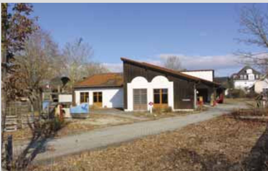
Es lohnt sich nicht mehr, den Kindergarten Regenbogenland im Erikaweg an den Sandwellen zu sanieren.

wird in Bildungsausgaben investiert. Landrat Neumeyer betonte in seiner Rede die symbolische Bedeutung des Namensgebers des Stipendiums: „Johann Turmair (...) war Universalgelehrter, Humanist und Pädagoge. Ein sehr gutes Vorbild.“ Die Stipendiaten sollen auch zu einer Gemeinschaft zusammenwachsen. „Durch die langfristige Bindung der Partner“, so Projektleiterin Aslihan Richter, „können wir jedes Jahr etwa 15 bis 20 Stipendien vergeben.“ So entstünde ein Netzwerk.