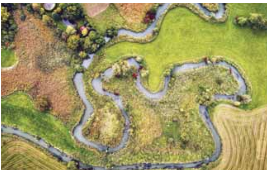
Welche Planinhalte der Landschaftsplan der Stadt Abensberg nach dem Prozess beinhaltet, wird hier gut erklärt: www.abensberg.de/landschaftsplan

mune ihn sich zu eigen macht, Beteiligung frühzeitig mitdenkt und eine ganzheitliche Vision entwickelt, so die Akademie. Bei der Podiumsdiskussion (Bild oben) wurde klar: Die Stadt Abensberg hat sich frühzeitig als Modellkommune angemeldet und gemeinsam mit dem Stadtrat und Gebietskennern, Bauernobmännern und Unternehmern das Projekt „Landschaftsplanung in Bayern – kommunal und innovativ“ vorangetrieben.