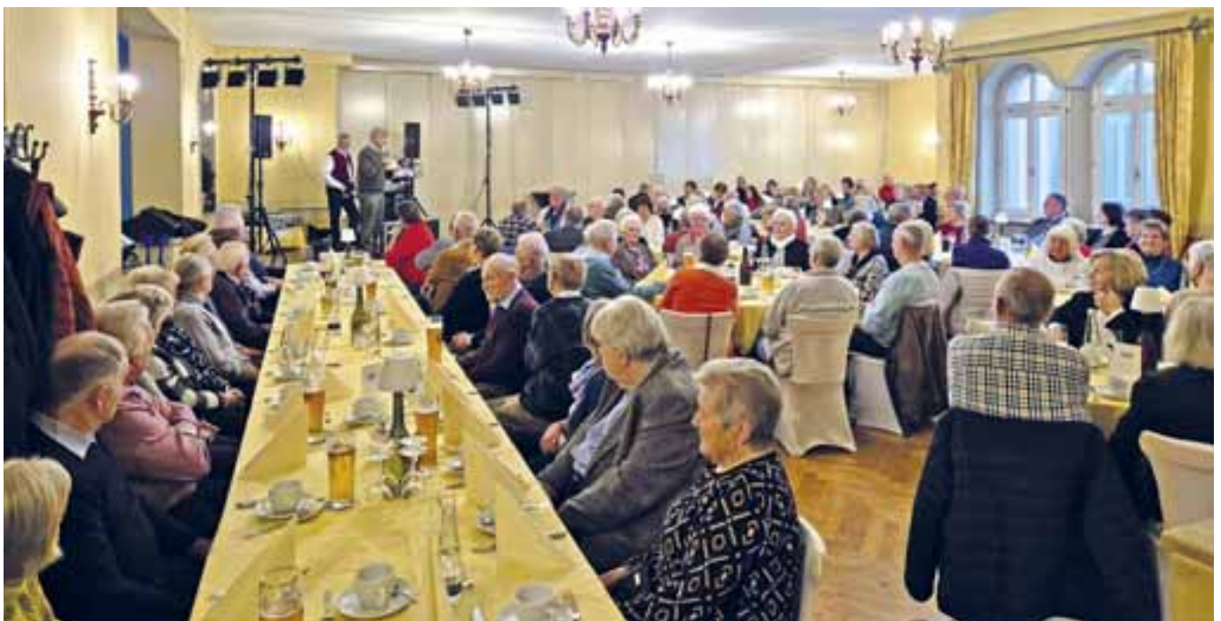
Rund 280 Jubilare folgten der Einladung in den Jungbräu-Saal.

Niemand muss alleine bleiben. Ein herzlicher Dank geht an alle, die zum Gelingen der Jubilarefeiern beigetragen haben: den Mitarbeiterinnen und Mitarbeitern der Stadtverwaltung Abensberg, Abteilung Generationenarbeit, den Mitgliedern des Seniorenbeirats und dem Personal des Gasthofs Jungbräu.