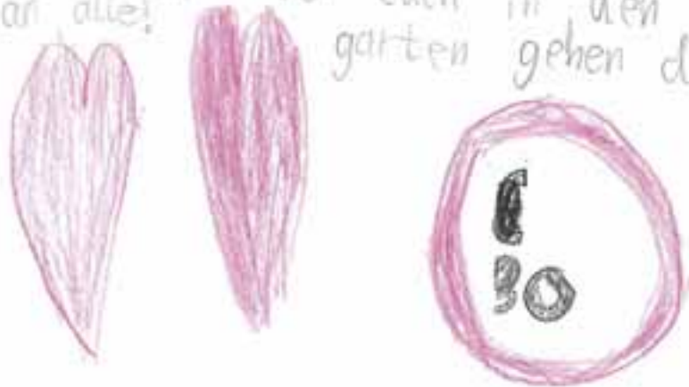
Wenn so ein Brief im Kasten liegt ... Dankeschön, Hanna!

Hallo Lieber Kindergarten Alles gute zum 30sigsten Gebustag. Ich wünsche für das Neue Jahr viel Liebe und Glück viel Fertrauen und licht und Wärme und das viele Wünsche in erfüfung gehen Herzliche Grüse Eure Hanna ! Und Danke das ich bei euch in den Kinde an alle! garten gehen durfte