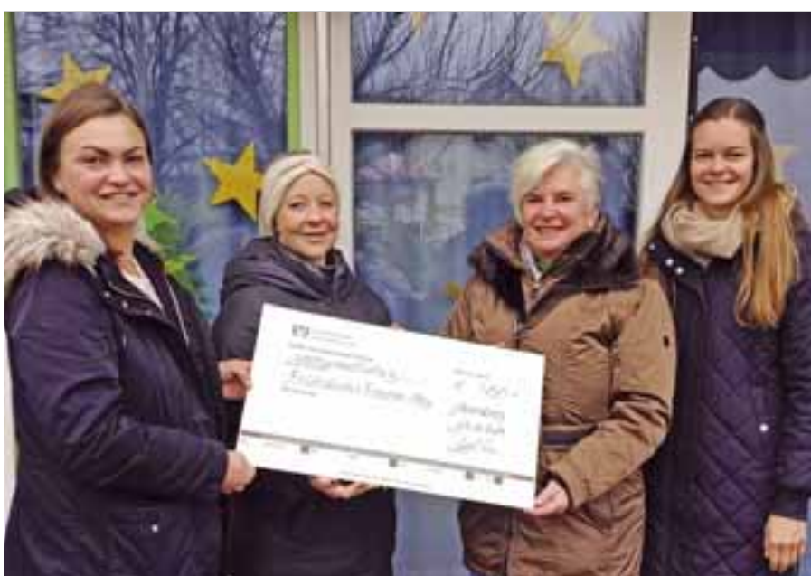
Elne Spende für die Abensberger Frühstücksfreunde.