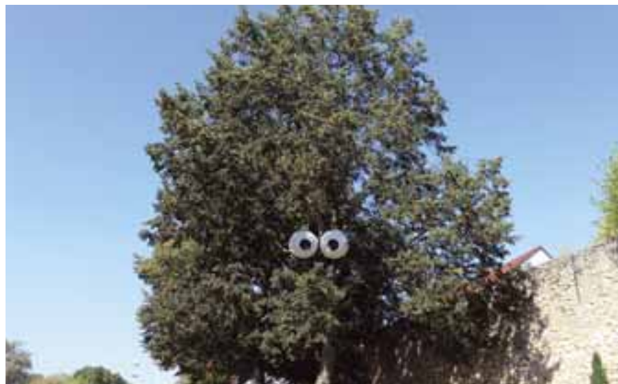
Mit dem Mikrozensus wird die Lage der Bevölkerung abgefragt.