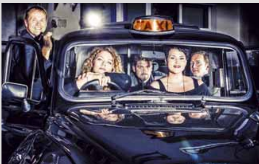
Das verschobene „Yellow Cab“-Konzert vom November findet jetzt statt – am Samstag, 15. März.