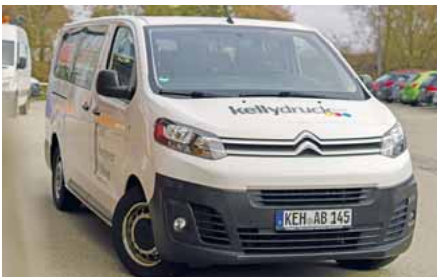
Nach dem Aus für das Rufbus-System KEXI hat die Arbeitsgruppe Mobilität der Stadt den Bürgerbus ins Leben gerufen.