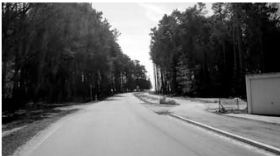
Der Radweg von Sandharlanden nach Bad Gögging