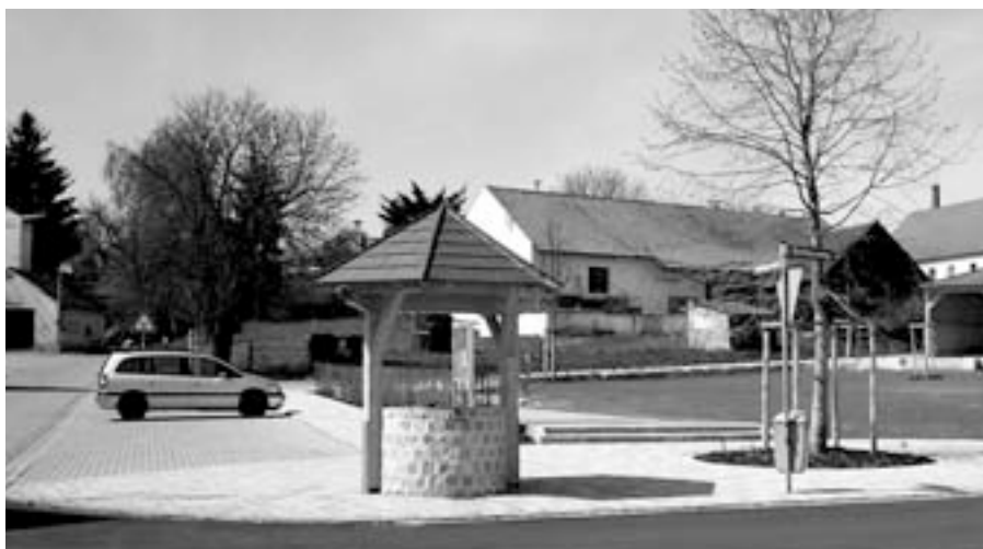
Der Dorfplatz in Arnhofen

Der Dorfplatz in Arnhofen ist fertiggestellt. Dieser neue Mittelpunkt in Arnhofen wird im Laufe des Jahres 2010 offiziell seiner Bestimmung übergeben werden. Ich danke an dieser Stelle ganz herzlich allen, die sich am Planungsprozess beteiligt haben, insbesondere der Arnhofer Bevölkerung. Ich denke es ist ein wirklich schöner und gestalterisch gelungener Ort der Begegnung geschaffen worden.