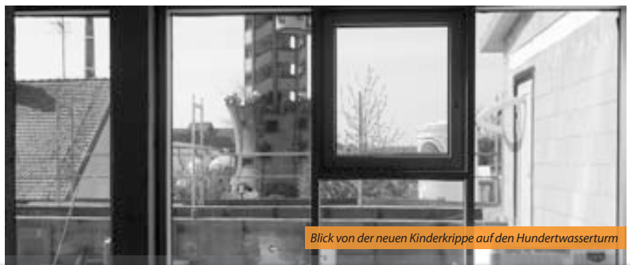
Blick von der neuen Kinderkrippe auf den Hundertwasserturm

Wir hoffen, dass die neue Kinderkrippe zum Jahreswechsel wie geplant in Betrieb gehen kann. Die neue Krippe wird in den bewährten Händen des Teams um Frau Rammelmeier bleiben. Schon jetzt sind Aufnahmeanträge durch die Eltern möglich. Wir ersuchen Interessenten unter Tel. 0 94 43/90 68 30 oder www.kinderkrippe-wichelstube.de Kontakt aufzunehmen.