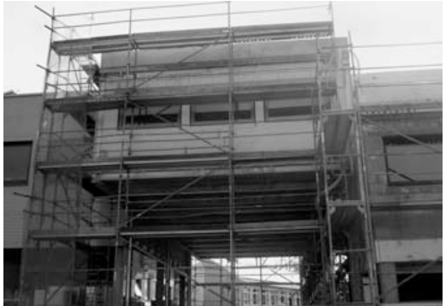
Hauptschule Abensberg: Erweiterung der Ganztagsbetreuung

ten Kollegium erfolgreich der Aufgabe gestellt, eine Ganztagsbeschulung anzubieten. Bereits im nächsten Jahr wird es eine 4. und eine (neue) 3. Klasse geben, in denen die Schüler ganztägig unterrichtet werden. Die Erfahrungen des bisherigen Betriebs sind überaus positiv. Die Umstrukturierung des Standortes Offenstetten bedingt allerdings auch einen Erweiterungsbau. Die Planungen hierzu sind abgeschlossen. Mit dem Bau wird demnächst begonnen. Im Zuge dieser Maßnahme wird die Schule auch einen Lift erhalten und ist damit barrierefrei. Während der Bau-phase stellt die Pfarrei dankenswerter Weise das Pfarrheim zur Verfügung, um die Mittagsverpflegung der Kinder sicherzustellen.