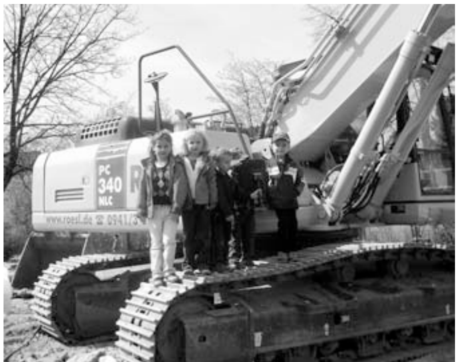
Die Baumaschinen beim Kindergarten in Offenstetten werden inspiziert