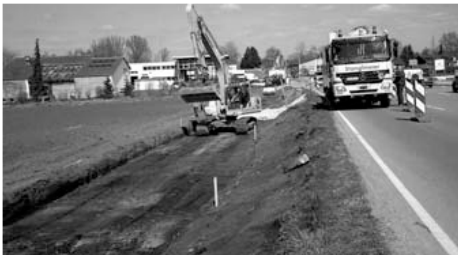
Der Radweg von Abensberg nach Welschenbach

Die notwendigen Verträge zur Sicherung der Grundstücke sind nahezu vollständig abgeschlossen. Wir hoffen, dass bis Mai alle noch notwendigen Optionsverträge unter Dach und Fach sind. Dann wird es am Landkreis liegen, den seit langem von der Bürgerschaft gewünschten und aus Sicherheitsgründen sinnvollen Radweg vom BBW nach Arnhofen zu bauen.